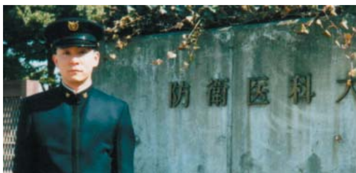
防衛医科大学卒業前日に正門前で

他学より少し遅れて初任実務研修（初期研修）が始まることに加えて、防医大では当時としては珍しいローテート研修が行われていました。現在の研修制度ではローテート研修が当たり前ですが、その頃はほとんどの大学では卒業直ちに医局に入局して専門医を目指す、所謂ストレート研修が行われていました。自衛隊では、部隊や艦艇の医務室であらゆる傷病に対する初期対応ができるスキルを備えた医官が求められます。そのために「総合臨床医」の育成を謳って、内科を6ヶ月、外科を3ヶ月、麻酔科または救急を3ヶ月、内科・外科以外から選択した4つの診療科を6ヶ月研修し、将来専攻しようとする診療科の研修は6ヶ月間しか受けられませんでした。研修医を終えた時、同じ年に卒業した全国のライバルは既に専門科目のキャリアが2年あるのに対し、自分たちは半年しか研修できていない、しかも研修医が終わったら全国の部隊に配属され、専門医としてのトレーニングは遅れるばかりだと、不安は一層募りました。