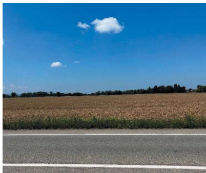
カステッラルクアートまでの道の途中で

2023年1月から8ヶ月間のミラノでの留学を終え、8月末に帰国いたしました。今回は私が研究するオペラ台本作家、ルイージ・イッリカ (Luigi Illica 1857-1919) の足跡を辿った旅についてご報告します。