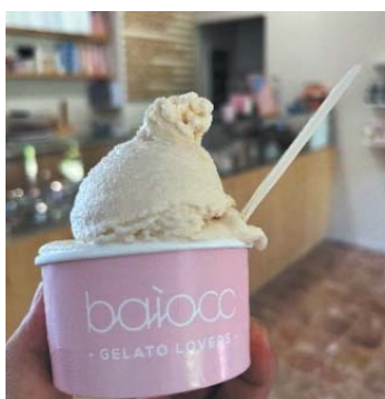
到着後すぐに食べたジェラート

ボッコーニ大学での聴講を終え、時間的に余裕を持てるようになった6月ごろ、イッリカの生まれ故郷であるカステッラルクアート (Castell' Arquato) というコムーネを訪れることにしました。コムーネというのはイタリアにおける自治体の最小単位であり、市や町のようなものですが、ここは人口5000人程度の、規模感としては町と言うより村といった場所で、中世のお城の雰囲気は今もなお残っており、ちょっとした観光地となっています。このコムーネにはイッリカ博物館なるものがあり、調べてみたところ、入館には予約が必須となっていたので、ある日曜日の朝、電話でどの日時であれば予約できるかを尋ねてみました。すると担当者から「今日ちょうど予約の枠があるから16時30分に観光課の窓口に来てくれ」とのこと。しっかり準備をして行くつもりが、思いがけずイッリカの故郷に行くことになり、旅は急遽始まることとなりました。