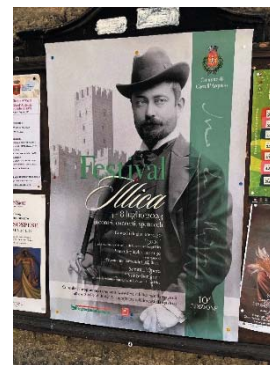
フェスティバルのポスター

さまざまな人との出会いや思いがけないことの連続ではありましたが、留学目的の1つであった研究資料の収集が達成できたのはとても喜ばしく思います。最後になりましたが、非常に充実した留学生活を送らせていただきました奨学会の皆さまに感謝を申し上げて、この報告を終えたいと思います。