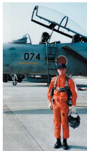
築城基地勤務時 F-15体験搭乗