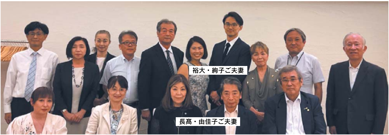
黒田奨学会主催の歓迎会