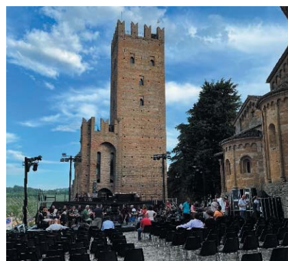
見学したリハーサルの様子