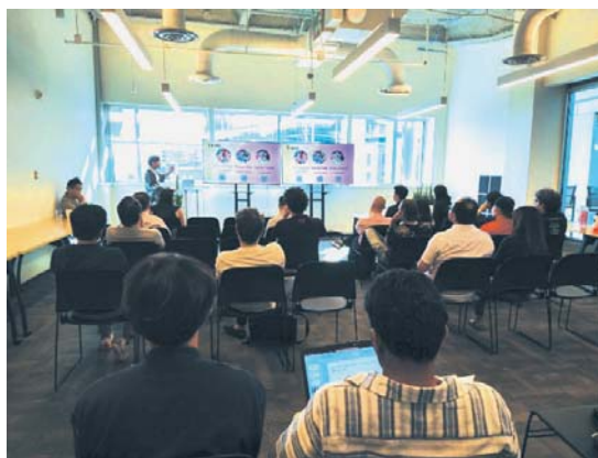
最終ピッチの発表風景