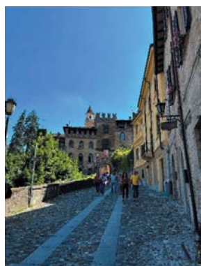
カステラルクアートの町